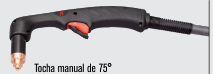
Tocha manual de 75°

(para mais opções de tochas, visite www.hypertherm.com )