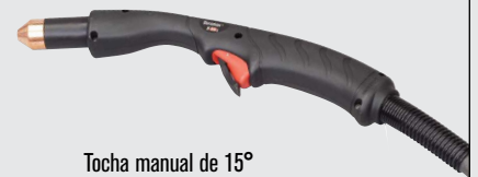
Tocha manual de 15°