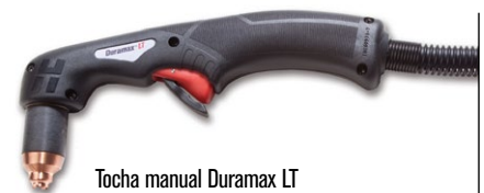
Tocha manual Duramax LT

(para mais opções de tochas, visite www.hypertherm.com )