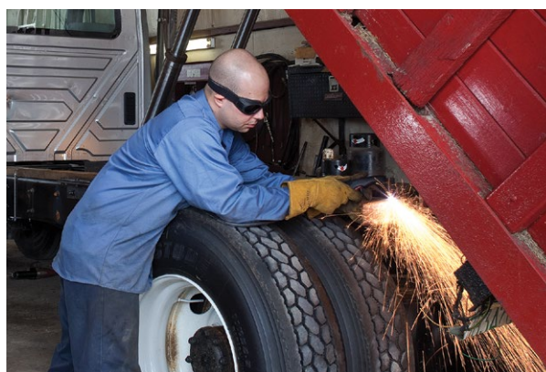
Reparo e modificação de veículos