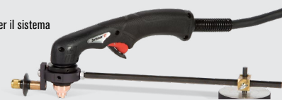
Guide per taglio circolare

Per saperne di più visita il sito www.hypertherm.com/powermax33XP