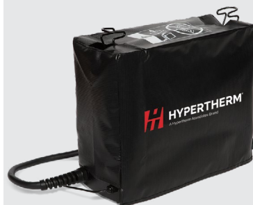
Custodia antipolvere per il sistema